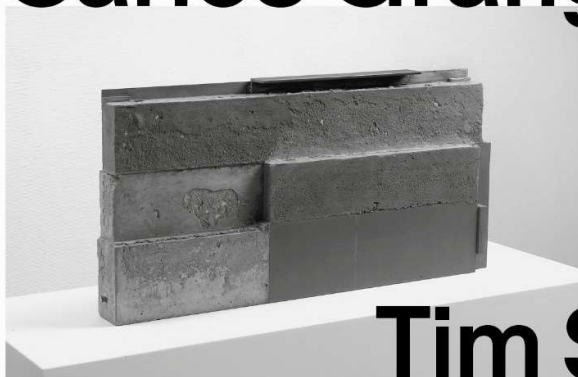
Carlos Granger „Amber“ 1997 Stahl 26,5 x 22,5 x 20 cm © Carlos Granger