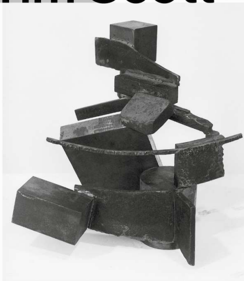
Tim Scott „Shard III“ 1976/77 Stahl 35 x 40 x 35 cm © Tim Scott